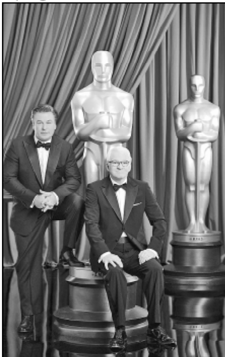
Церемонию, которая длилась три с половиной часа и проходила весьма неторопливо, вели Алек Болдуин и Стив Мартин.

82-я церемония награждения премии «Оскар» Американской академии киноискусств неожиданных сюрпризов не преподнесла. Выбор членов академии в пользу военной драмы «Повелитель бури» режиссера Кэтрин Бигелоу дает основания говорить о том, что «Оскар» вновь вручают не за достижения в области кинематографа, а за политические и идеологические убеждения. Стоит также отметить, что госпожа Кэтрин Бигелоу стала первой женщиной-режиссером, которая получила премию «Оскар».