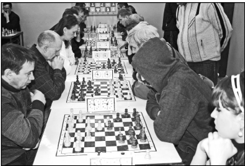
В шахматном турнире, проходившем по швейцарской системе в семь туров, приняли участие семнадцать команд.

Пресс-служба ГУ-Отделения Пенсионного фонда РФ по Омской области.