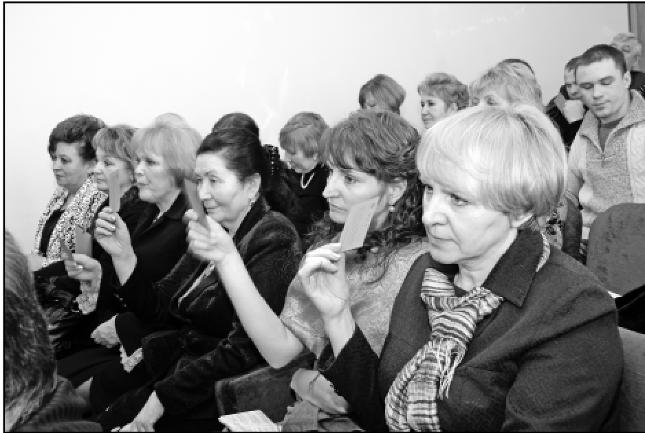
В оценке работы обкома и выборе председателя облпрофорганизации делегаты проявили единодушие.