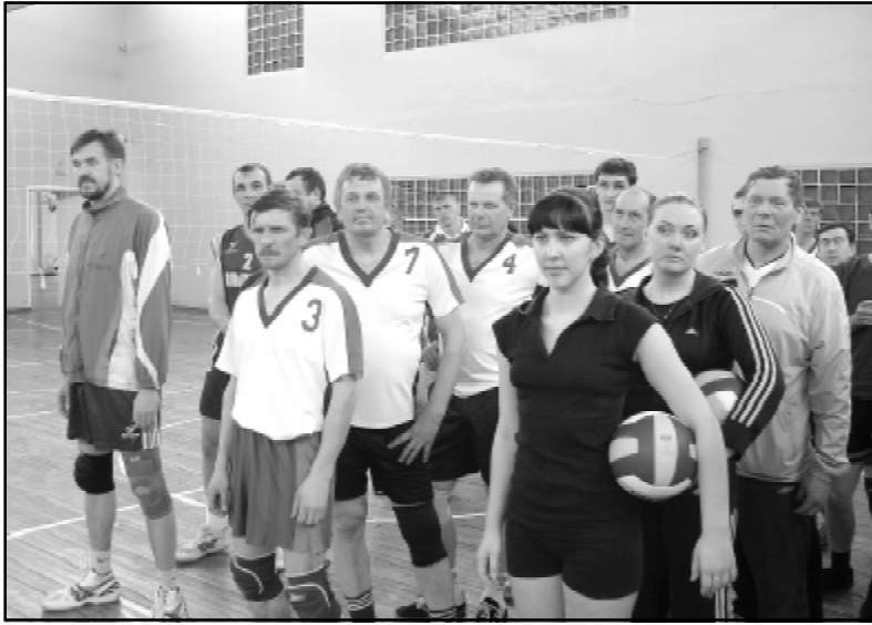
По условиям соревнований в каждой волейбольной команде должно было быть как минимум две женщины.

Семнадцать команд приняли участие в соревнованиях по шахматам. Каждая состояла из трех человек - двух мужчин и одной женщины. Турнир проходил по швейцарской системе в семь туров, игроку на обдумывание партии давалось 15 минут. Неожиданности не произошло (в шахматах вообще