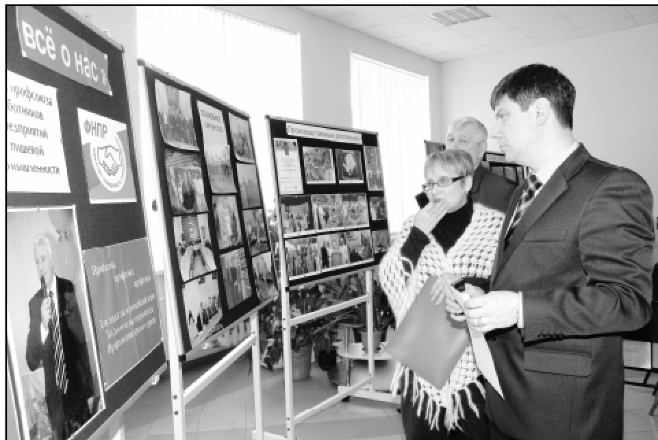
Главные события в жизни облпрофорганизации за прошедшие пять лет предстали перед участниками конференции на фотовыставке.

В выступлении председателя облпрофорганизации была затронута и проблема охраны труда - одна из самых злободневных для предприятий отрасли. На большинстве из них пока не удается избежать несчастных случаев на производстве. Расследования, всегда проводимые при участии представителей профорганов, показывают, что причинами здесь часто являются неудовлетворительное содержание рабочих мест, нарушение профдисциплины, недостатки в порядке обучения и инструктажа. Поэтому соблюдение законодательства в сфере охраны труда обком держит на особом контроле, регулярно устраивает соответствующие проверки совместно с Госинспекцией и технической инспекцией труда ФОП. Ежегодно организуется обучение уполномоченных по охране труда. Непосредственно на производстве специалисты УМЦ ФОП проводили занятия в ОАО "Мясокомбинат "Омский" и "Хлебодар". На ряде предприятий традиционными стали дни охраны труда, проходящие раз в месяц. Однако не везде лицам, осуществляющим общественный контроль за охраной труда, оказывается ощутимая поддержка со стороны профкомов и руководителей структурных подразделений. Обком рекомендовал председателям первичек внимательнее относиться к работе уполномоченных.