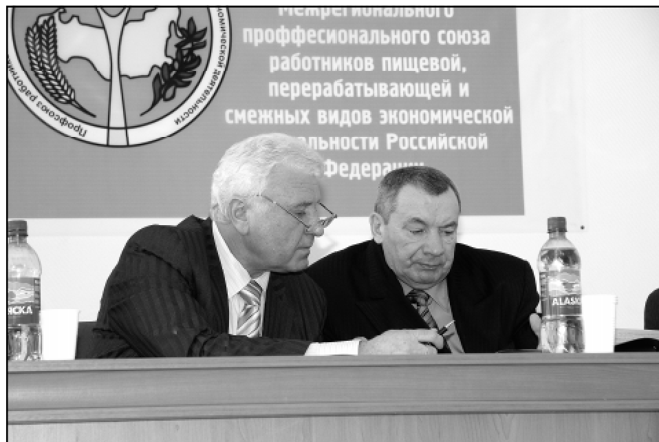
Обсуждение рабочих моментов в президиуме.

В минувшую пятницу, 12 марта, были подведены итоги работы Омской областной территориальной организации профсоюза работников пищевой, перерабатывающей промышленности и смежных видов экономической деятельности РФ за первые пять лет с момента ее создания. На II отчетно-выборной конференции облпрофорганизации присутствовали 43 делегата, представляющие первички предприятий отрасли.