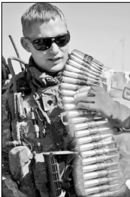
Так выглядят, по мнению Бигелоу, те парни, которые добровольно соглашаются участвовать в военных действиях.

Такой ход событий для среднестатистического зрителя выглядит несколько странно, особенно учитывая тот факт, что по сути «Повелитель бури» — картина весьма посредственная. И если бы ни шекотливая тематика войны в Ираке (в фильме госпожа Бигелоу показывает, кто же они, те парни, которые добровольно соглашаются участвовать в военных действиях, и почему они это делают), никаких открытий она в себе не